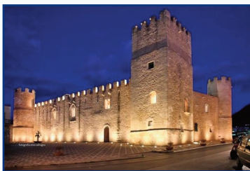
Alcamo - Castello dei Conti di Modica