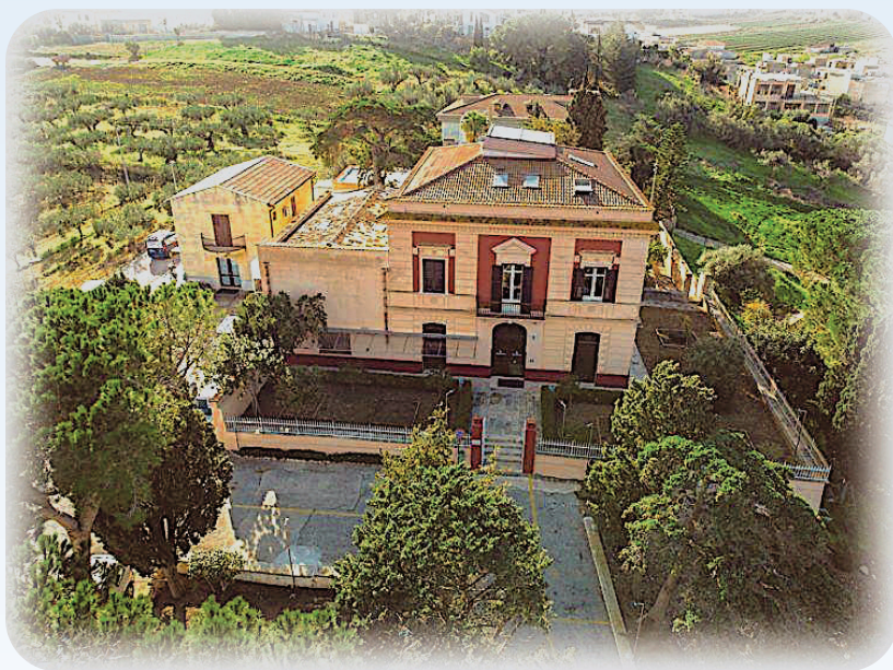
Centro medico di fisioterapia "Villa Sarina"