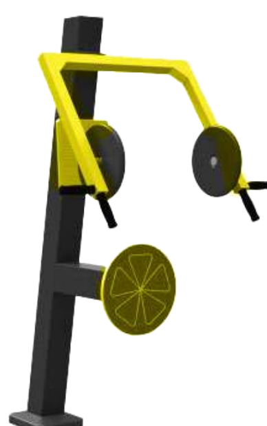
SHOULDER PRESS DISABLED LINE