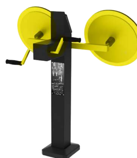
HAND BIKE + THAI CHI DISABLED LINE